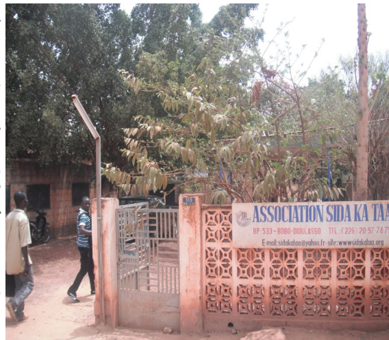
Siège de l'association SIDA KATAA

Un suivi particulier est accordé aux artistes primés pour la production de leurs œuvres et même pour la réalisation des clips vidéo. Il s'est avéré alors plus judicieux de former ces artistes sur le vih sida afin qu'ils communiquent directement avec les cibles lors de leurs prestations. Toute suite, ces artistes désormais formés sont devenus des relais incontournables dans le système de ventilation des messages sur le sida. Comme quoi, cette association participe ainsi à la réalisation de ces artistes tout en poursuivant son objectif qui est d'empêcher que le sida continue de faire des victimes. Cette démarche est très bien accueillie par les publics cibles qui ont toujours réagi positivement. Par la suite, il a paru nécessaire de diversifier les activités et SIDA KA TAA a compris cela très tôt.