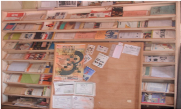
Une bibliothèque équipée en documents sur le vih

L'acquisition des connaissances étant un processus, les enseignants formés par l'association sont intervenus sur les thèmes du VIH/SIDA auprès des élèves des classes de CM1 et CM2 lors des cours de sciences naturelles et de français, conformément au protocole pédagogique conçu avec l'appui des conseillers et inspecteurs. En plus des contes, des bandes dessinées sont destinées aux élèves à un prix social de 500 frs l'unité. Ces bandes dessinées sont en fait une transcription des contes en images et les cibles que sont les enfants y ont bien adhéré.