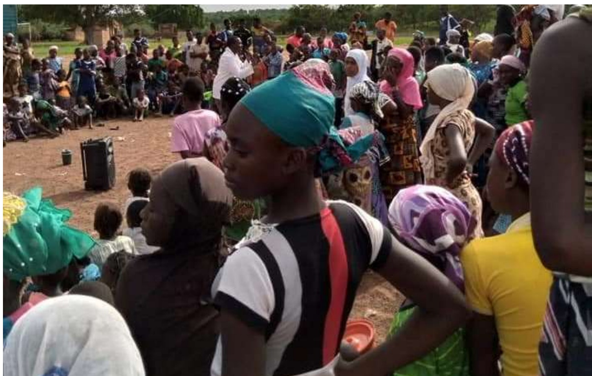
Image 7 : théâtre forum sur la santé sexuelle et reproductive avec les jeunes