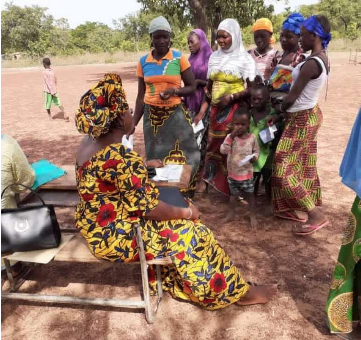
Image 9 : counseling avec des jeunes filles / femmes désireuses d'adopter une méthode contraceptive

Il faut signaler que pour cette activité, nous avons été débordé ar une forte demande de consultation et de prise en charge de diverses pathologie autres que génito-urinaire. C'est le cas de nombreux enfants qui nous étaient amenés pour des douleurs abdominales, des teignes, des fièvres, des toux et même des malnutritions.