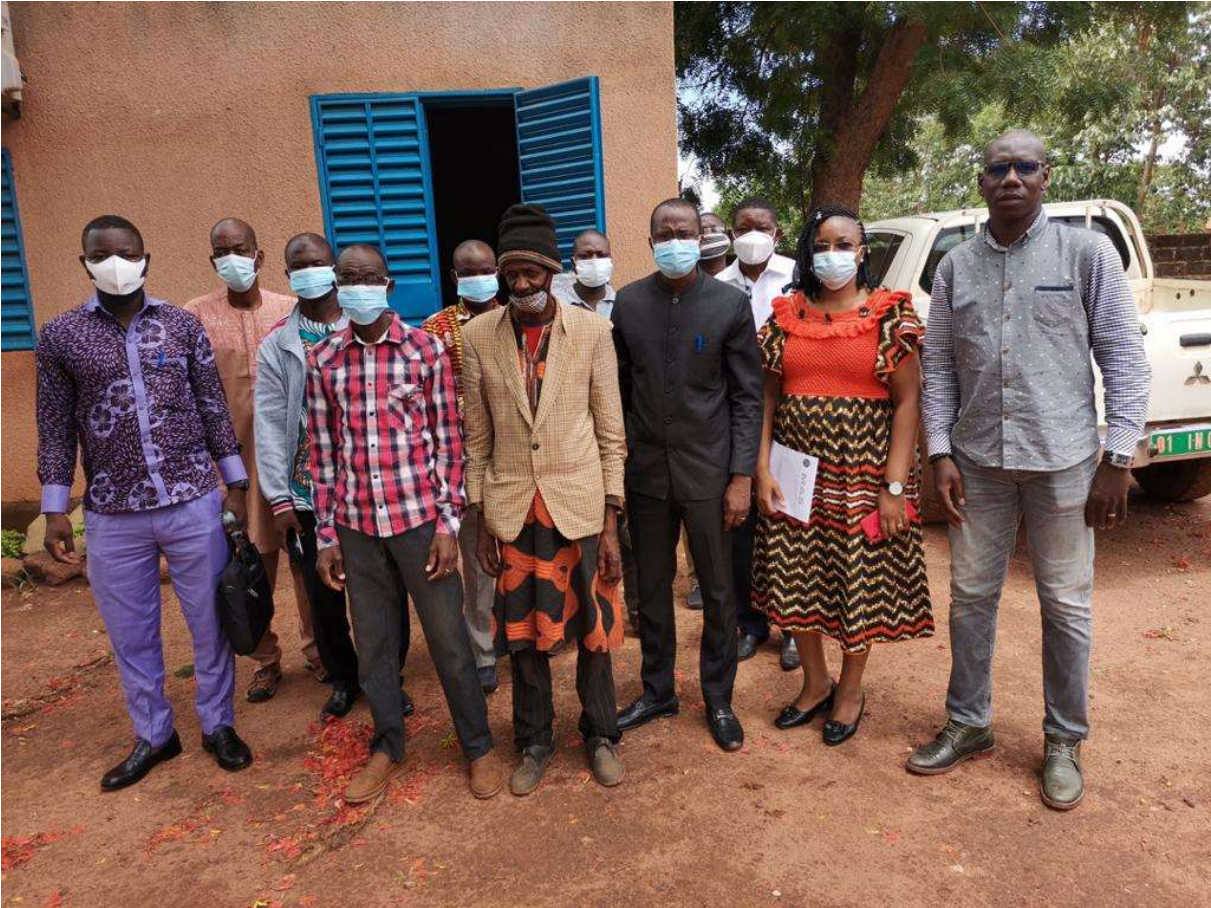
Image 3 : photo de famille avec les infirmiers des CSPS abritant les sites d'intervention