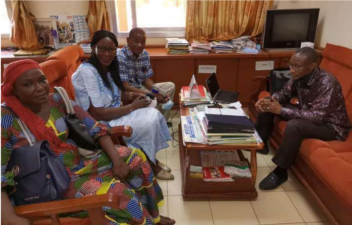
Image 2 : visite de courtoisie et d'information chez le Directeur régional de la femme, de la famille, de la solidarité nationale et de l'action humanitaire