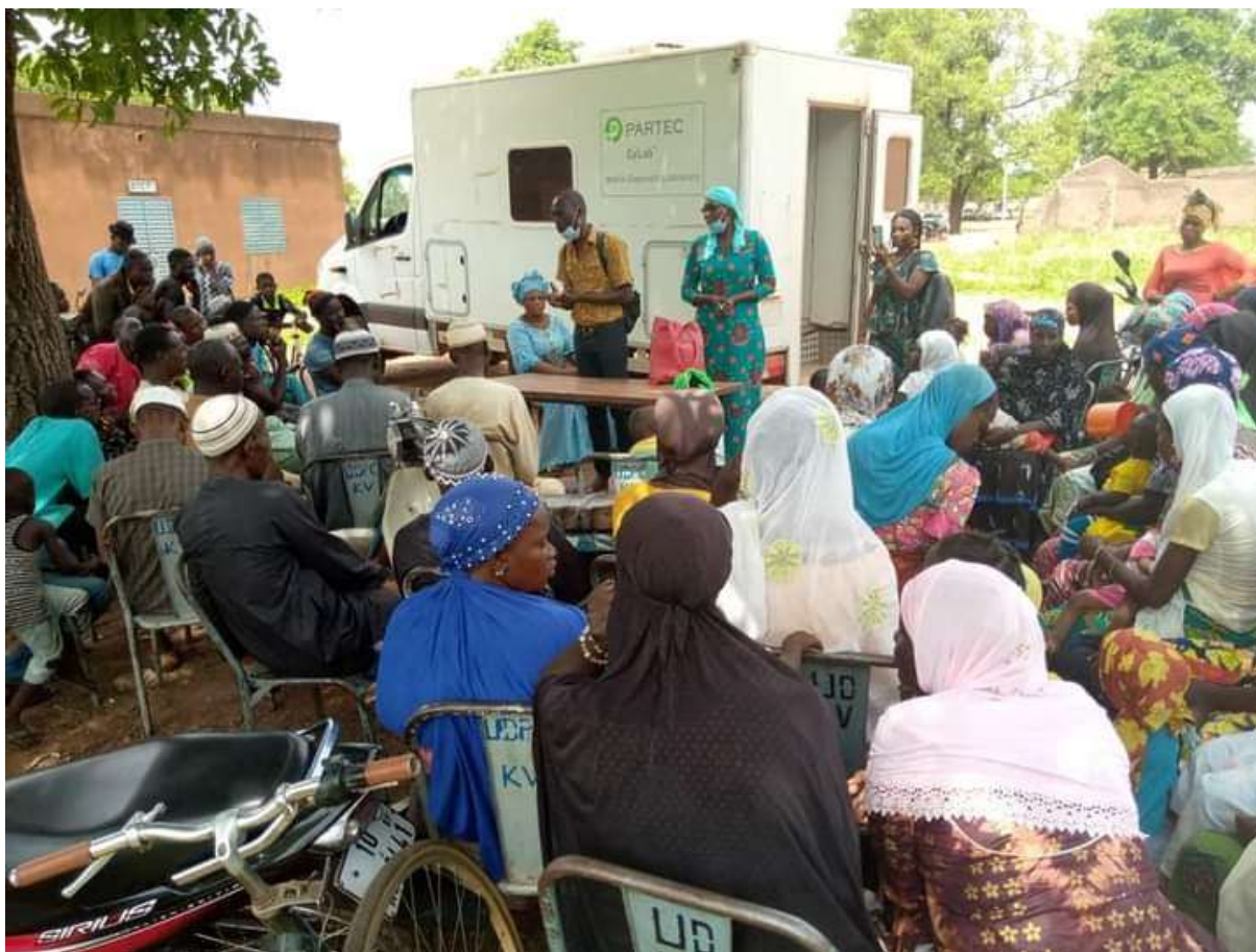
Image 5 : causerie éducatives sur la prévention des IST/VIH/Sida avant le CDV

Elles ont été réalisées par les animateurs de l'Association Djiguitougou de Bobo-Dioulasso. Elles ont couvert les dix sites cités plus haut. Sur 40 causeries prévues, 40 ont effectivement été réalisées, soit quatre séances de causeries par site. Elles ont été réalisées es par cible. Certaines ont ciblé les femmes, d'autres les jeunes filles / garçons et d'autre toutes les tranches d'âges confondues.