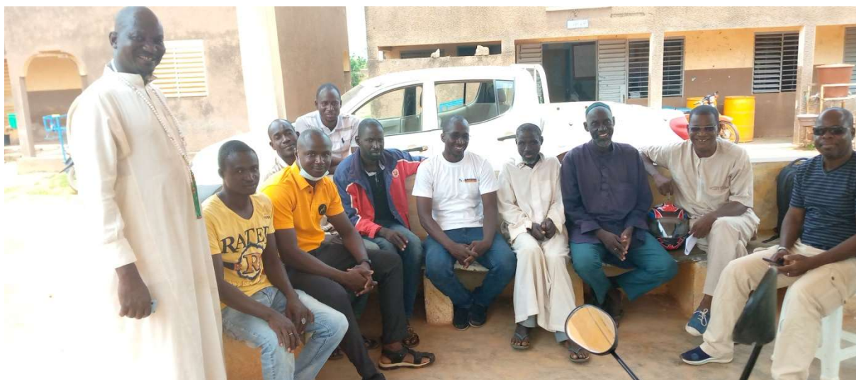
Image 14 : une équipe de la MAS et l'antenne régionale en supervision au CSPS de Koumbia

En collaboration avec les responsables des CSPS et des services du ministère de la Femme, de la solidarité nationale, de la famille et de l'action humanitaire , nous avons décidé de monter un microprojet pour les consultations en stratégie mobile. Ces consultations iront au-delà des services de SSR pour inclure le dépistage et la prise en charge des malnutritions, les consultations prénatales, le déparasitage des enfants etc.