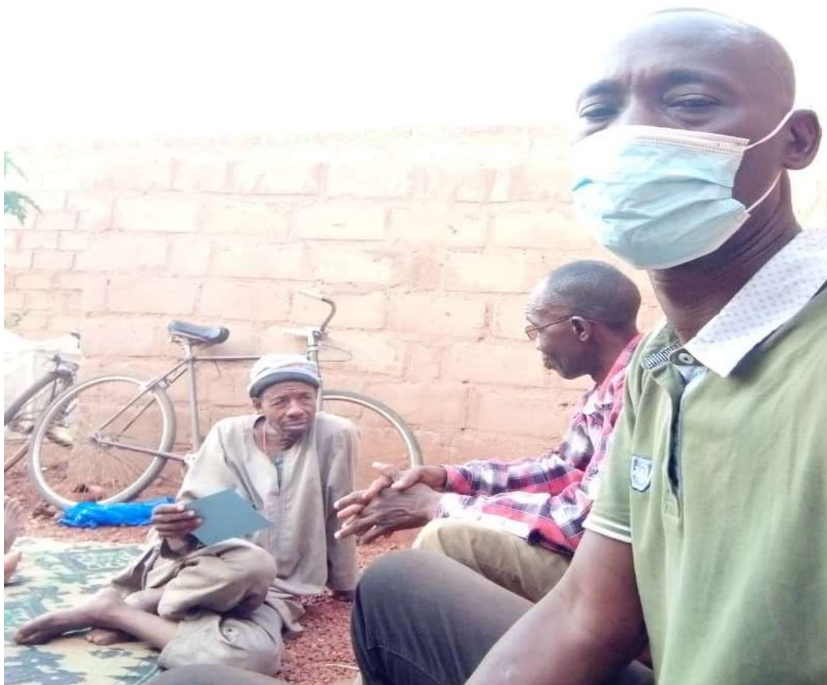
Image 13 : visite à domicile chez un patient présentant une toux chronique.