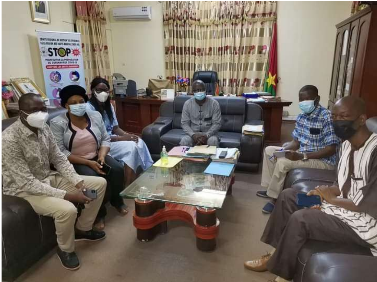
Image 1 : visite de courtoisie et d'information avec le Gouverneur de la région des Hauts-Bassins